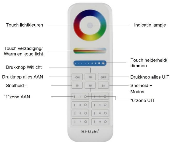
8 zone afstandsbediening FUT089 – RF2.4GHz